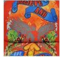
Heat Transfer Printing