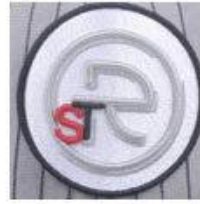
Woven Label Applique