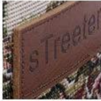
Soft Rubber Patch