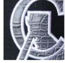
Embroidered Leather Patch