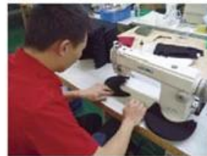
Edge Trimming Machine