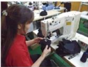
Eyelet Embroidering Machine