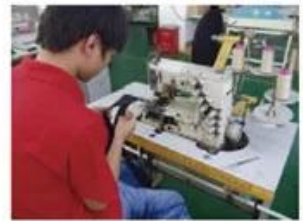
Sweatband Processing Machine