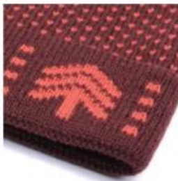
JACQUARD KNIT WOVEN TEXT OR GRAPHICS | ALLOWS FOR CREATIVITY