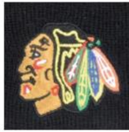
EMBROIDERY EMBROIDERED DIRECTLY ONTO FABRIC