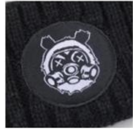
WOVEN LABEL & MERROWED EDGE HIGH DETAIL | RAISED MERROWED EDGING