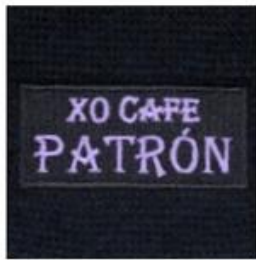
EMBROIDERED PATCH 100% EMBROIDERED PATCH | MERROWED EDGE