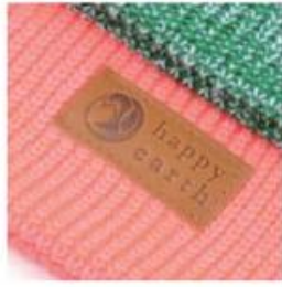
SUEDE/LEATHER FULLY STAMPED LEATHER OR SUEDE

Customize your beanie with your personal branding or artwork. Choose from any of these styles and get creative with your design.