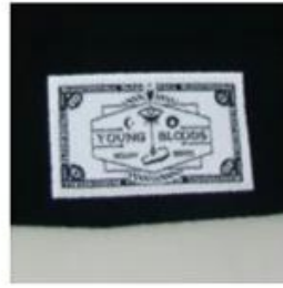
WOVEN LABEL HIGH LEVEL OF DETAIL | SEWN DIRECTLY TO FABRIC