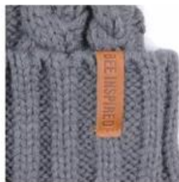
PINCH TAG WOVEN | SIZE AND SHAPE MAY VARY