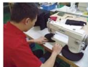
Edge Trimming Machine