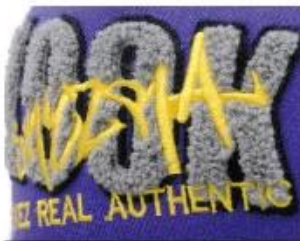
APPLIQUE WITH TOWEL