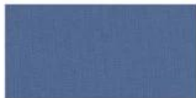
NYLON Tough lightweight synthetic fiber based fabric, durable and flexible