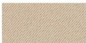
COTTON TWILL Cotton fabric woven with diagonal parallel ridges