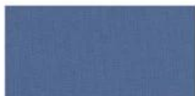
NYLON Tough lightweight synthetic fiber based fabric, durable and flexible