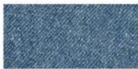
DENIM Ultra-thick cotton twill patterned fabric. Same material as blue jeans