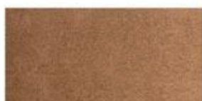
SUEDE Soft leather with a napped exterior surface