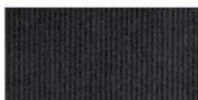
CORDUROY Thick cotton fabric with velvety ribs