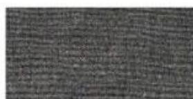
ACRYLIC Synthetic fiber based fabric. Often used for bucket hats