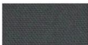
COTTON CANVAS Strong, rough, tightly woven cotton fabric