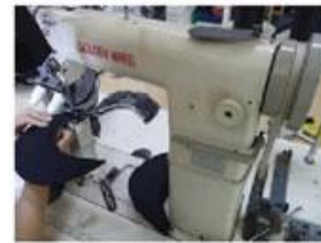
Special Streamlined Lockstitch Machine