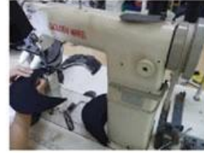
Special Streamlined Lockstitch Machine